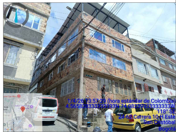
PERSPECTIVA GENERAL PREDIO