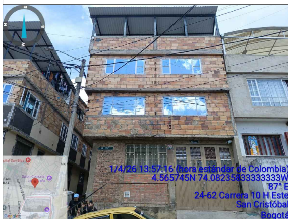
VISTA FRONTAL PREDIO