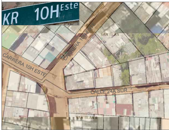
LOCALIZACIÓN PREDIO CARRERA 10H ESTE NO. 24A - 6E